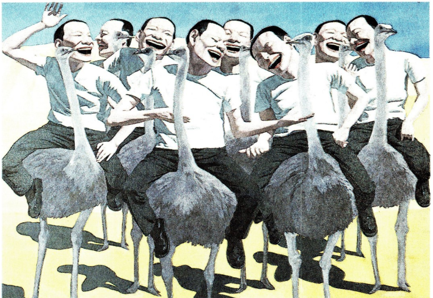
Minjun Yue. «Ostriches» (1997), San Francisco, Museum of Modern Art